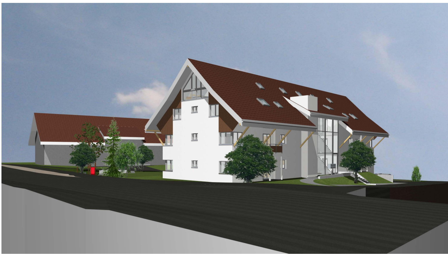
Visualisierung von Nordost