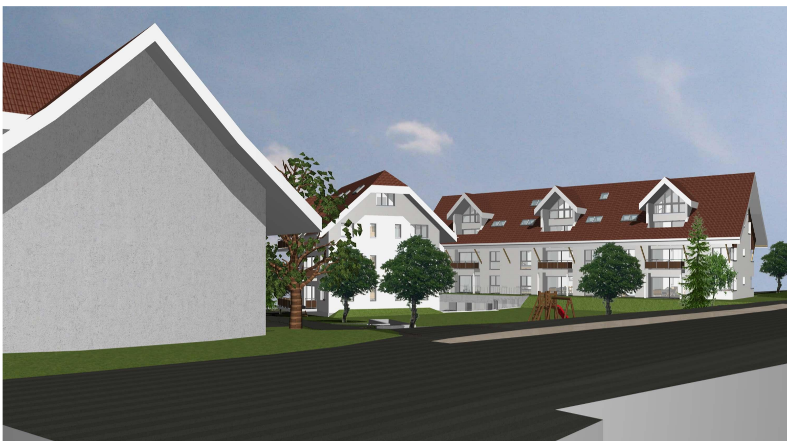
Visualisierung von Südost