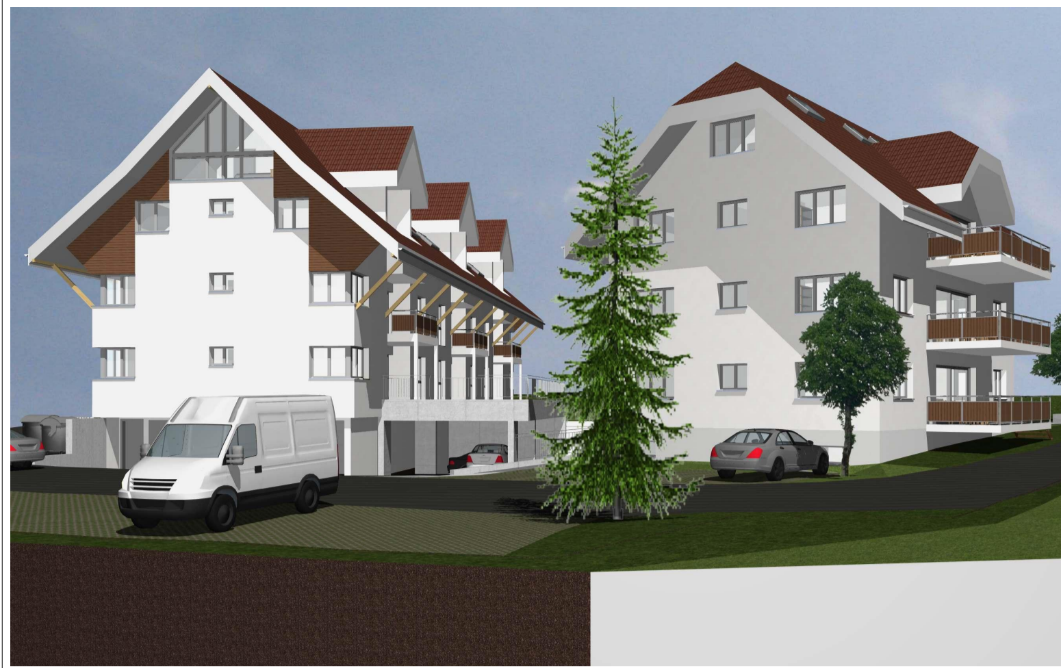
Visualisierung von Südwest